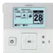
sterownik przewodowy standardowy z programatorem tygodniowym